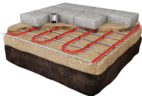
Installatie in zandbed onder klinkers