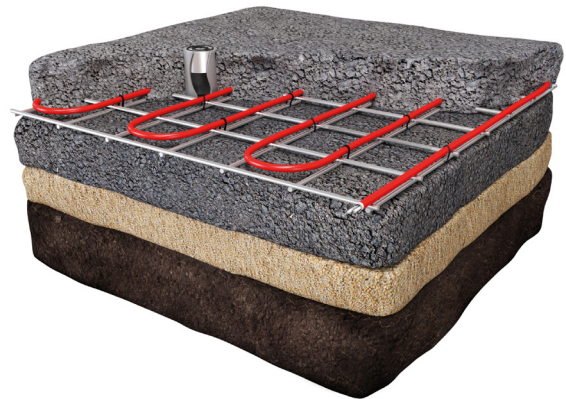
Installatie in ongewalst asfalt