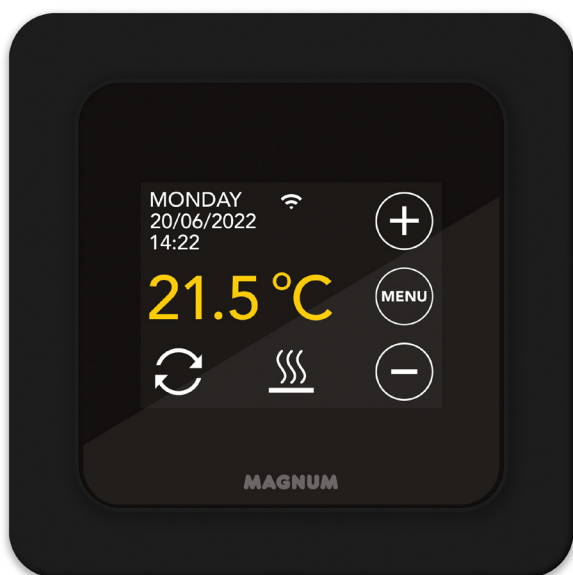
Optioneel: Grafietzwart - RAL 9011